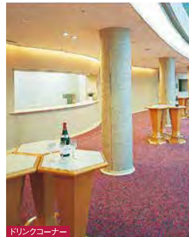
ドリンクコーナー