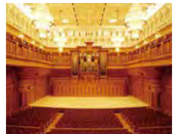
サラマンカホール