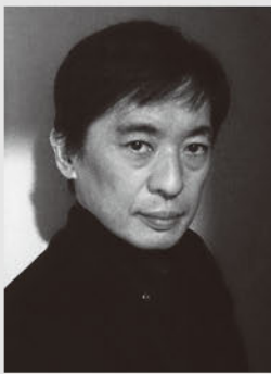
浦久俊彦 Toshihiko URAHISA

旧ソ連生まれ。ラトヴィア、オランダ、ドイツなどでオルガンとピアノの研鑽を積む。ロシア・クラスノヤルスク・フィルハーモニー協会の専属オルガニストを経て、1991年からは、イスラエル・フィルハーモニー管弦楽団の客演首席オルガニストを務める。現在、テル・アヴィヴ大学音楽アカデミーのオルガン科教授を務める傍ら、パリ・ノートルダム大聖堂をはじめ、ヨーロッパ各地の伝統あるオルガンによるリサイタルのほか、世界の主要なオルガン音楽祭にも招かれている。レパートリーは、ブクステフーデ、バッハなどのドイツ・バロック音楽から、メンデルスゾーン、ブラームスなどロマン派音楽まで幅広いが、なかでも、バッハのスペシャリストとしての評価が高い。日本には、指揮者ズービン・メータとイスラエル・フィルハーモニー管弦楽団のソリストとして来日している。