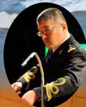
指揮者：舞鶴音楽隊長 1等海尉 高野 賢一