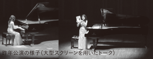
昨年公演の様子(大型スクリーンを用いたトーク)