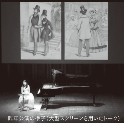
昨年公演の様子(大型スクリーンを用いたトーク)