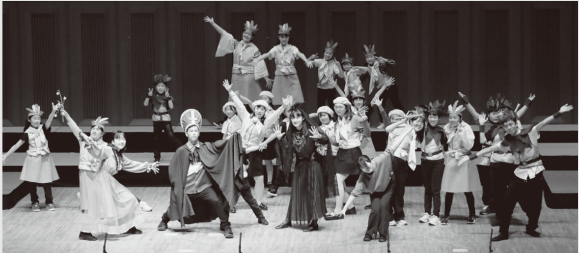
サラマンカ少年少女合唱団 CORO Junior (コロジュニオール)