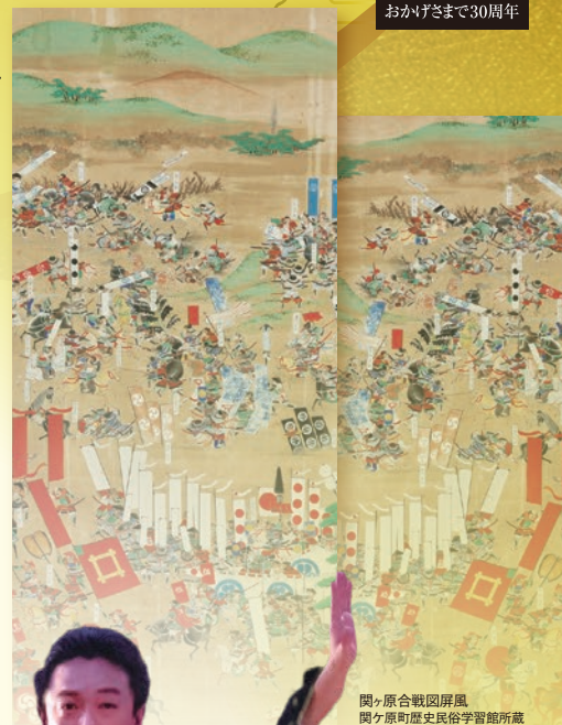
関ヶ原合戦図屏風 関ヶ原町歴史民俗学習館所蔵